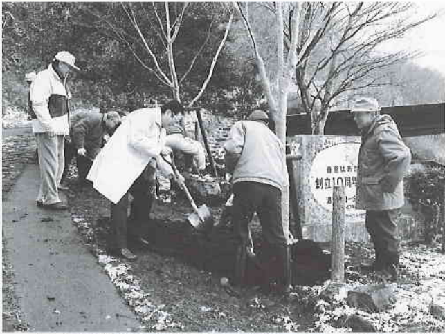
40周年記念事業 イロハ紅葉成木植樹 大観山城山入口