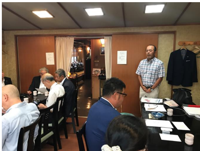
情報集会社会望月会員

今月は会員増強月間です。夜間例会を情報集会に切り替え、全員をA, B, C 3班に分かれて各班で新会員候補者を推薦した結果、例年どおり多数の方々の名前を出して頂きました。そして10名以上の方々を候補として挙げる事が出来ました。夫々の班での候補者には積極的にアプローチして頂き、よりよい結果の報告が出来るように努力をお願い致します。