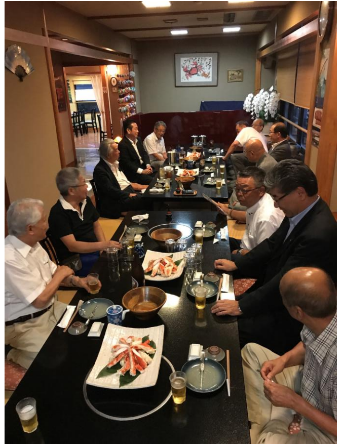
情報集会后懇親会