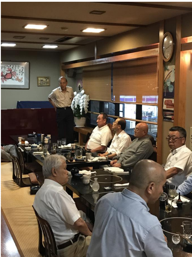
情報集会后懇親会閉会伊藤会員